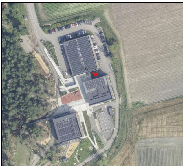
Figur 2 Inngang ifm. åpent informasjonsmøte vist med rødt kryss

Informasjonsmøtet avholdes i personalrommet på skolen og det er inngang fra østsiden av skolebygget som vist med rødt kryss på figur under.